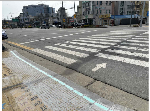
2024년 어린이보호구역(회덕초외 3개소) 바닥신호등 설치공사