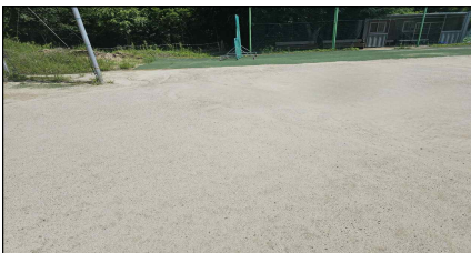
덕암야구장 바닥 정비