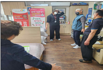
만성질환관리 근력강화 운동교육