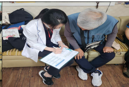
맞춤형 영양상담 및 식사요법 교육