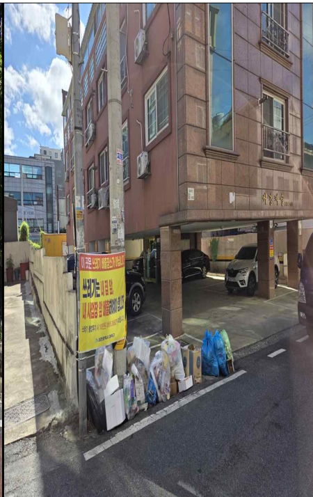
중리로7번길 36-8 앞