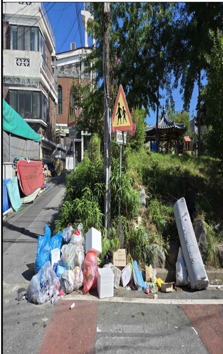
중리동 398-18 앞