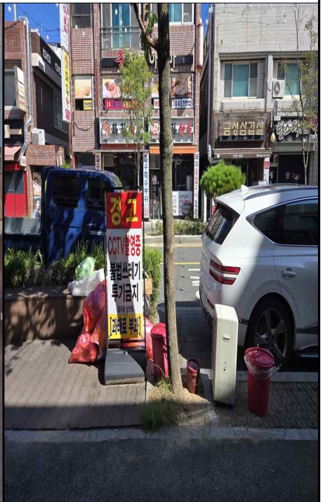
중리남로 29 앞