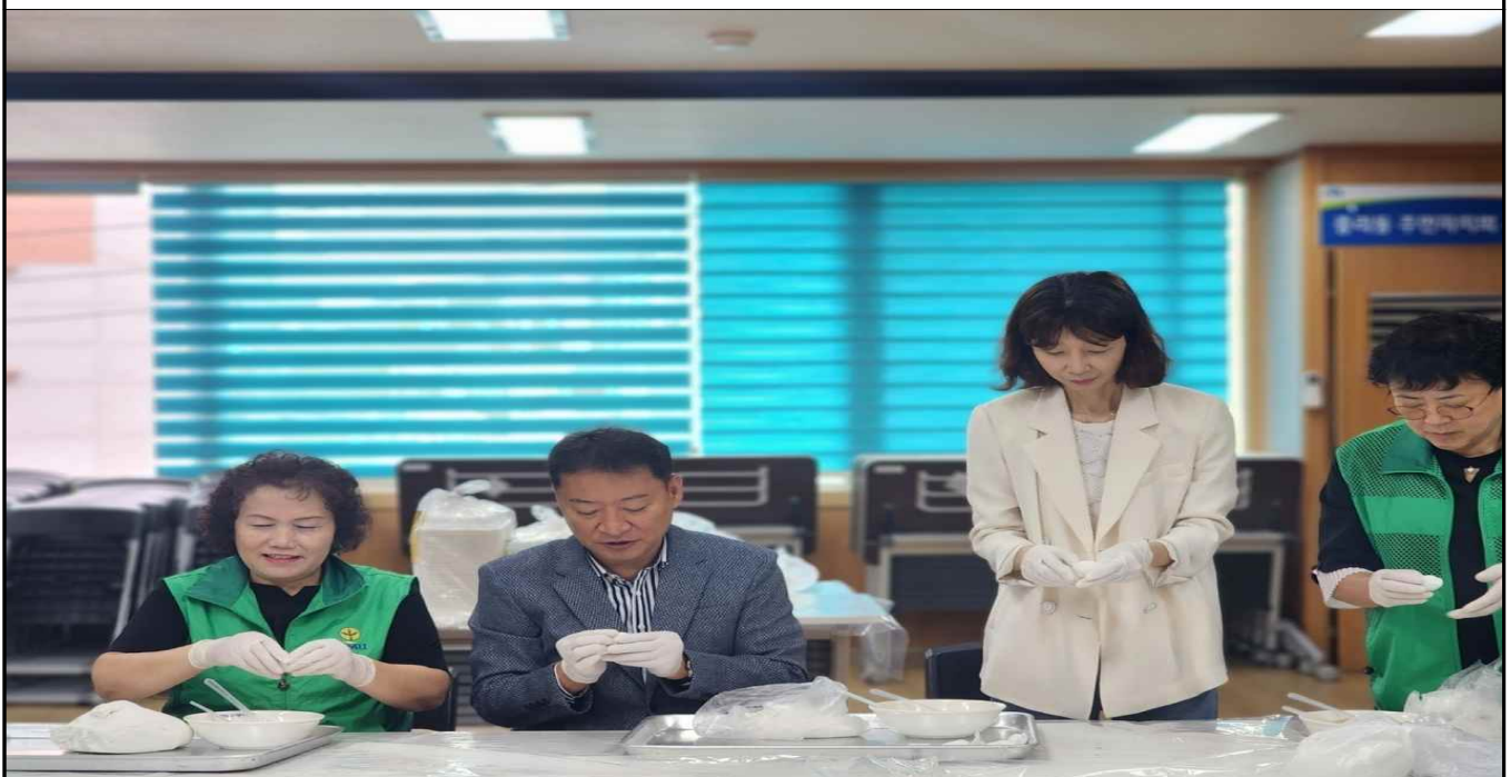
평상시 洞 행사 및 봉사활동 시