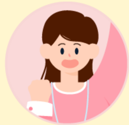
복지정책과 이정현 주무관