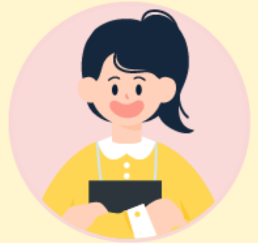
문화관광체육과 이경애 팀장