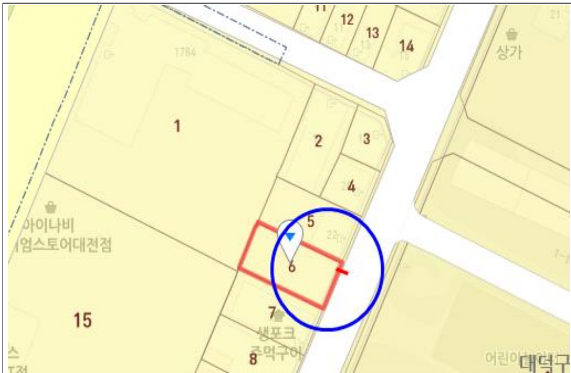
비래동 555-6번지 앞