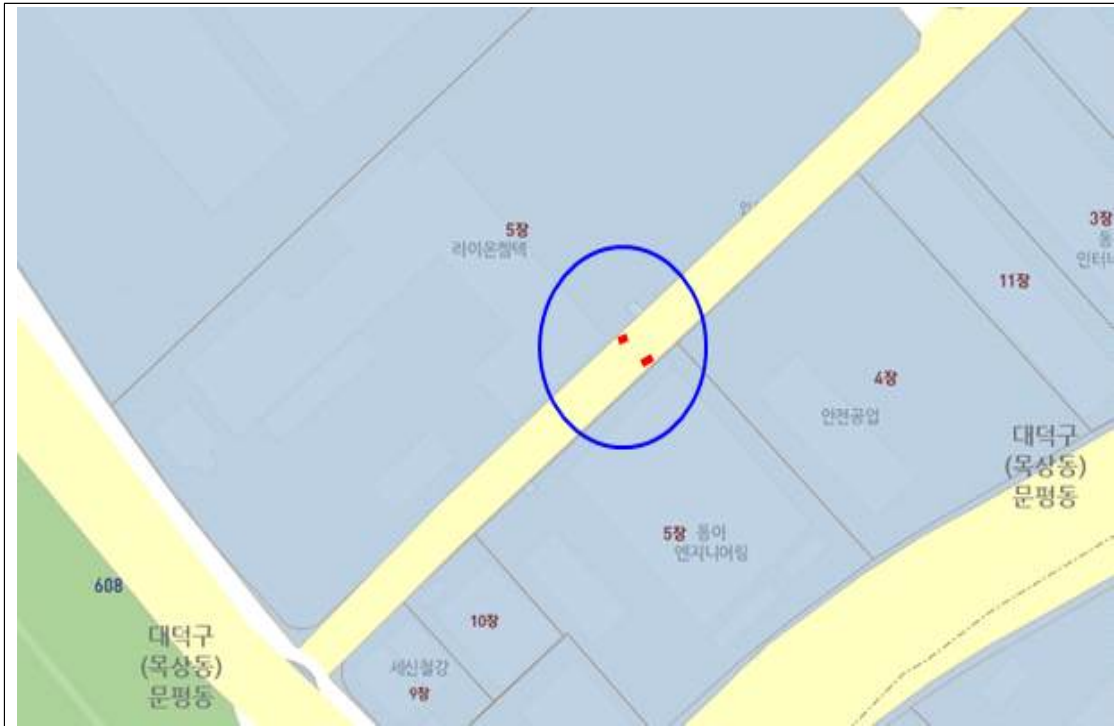
문평동 41-2번지 앞