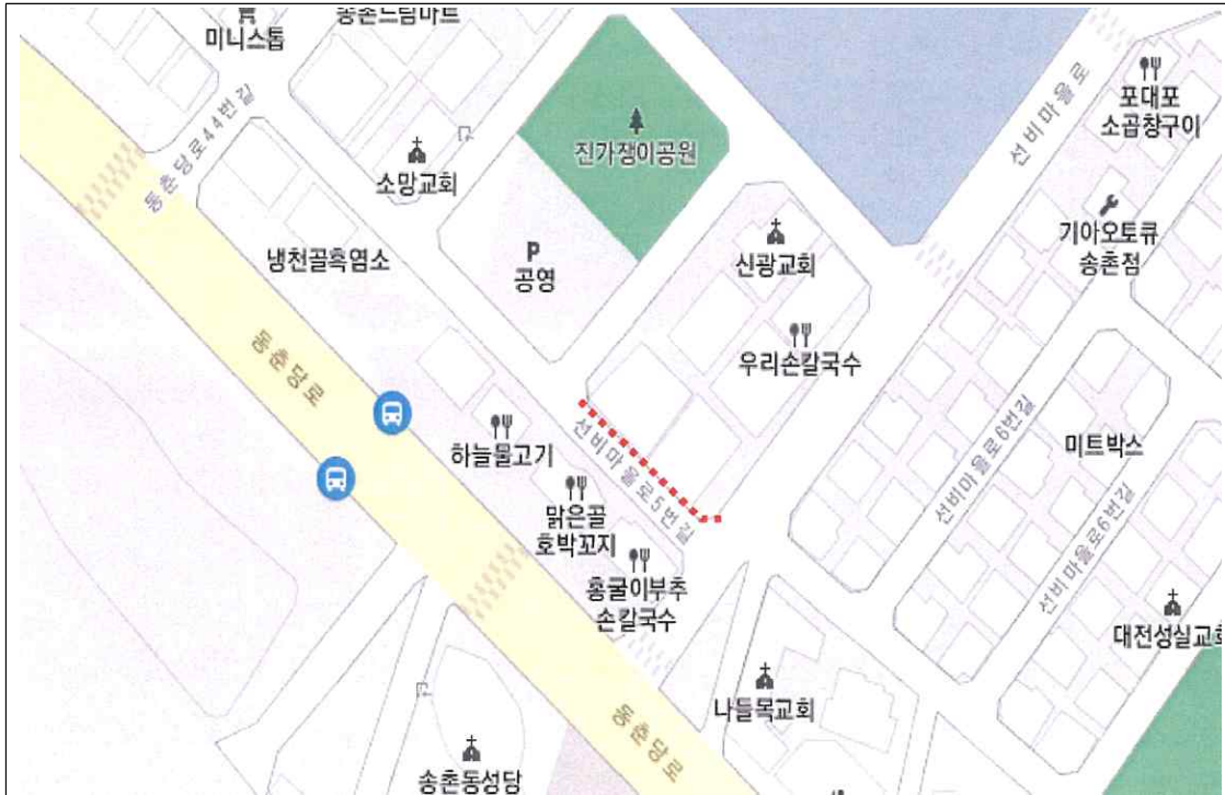
송촌동 528번지 일원