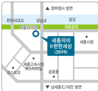
건본주택주소 : 세종특별자치시 대평동 264-1